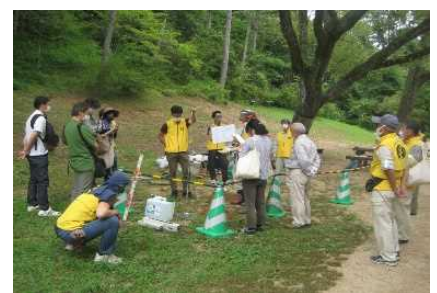
ソメイヨシノ樹齢150プロジェクト