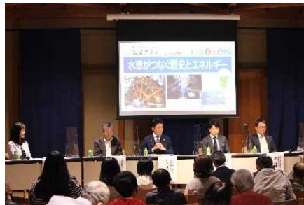
シンポジウム開催