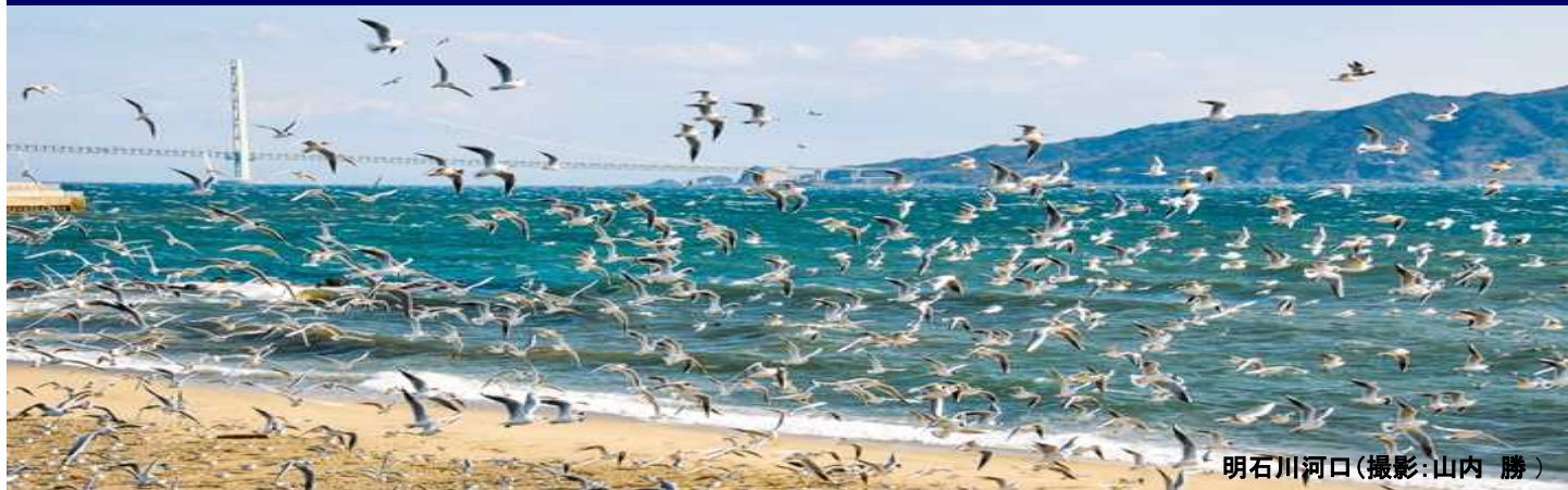
明石川河口

海への理解を深め、豊かで美しい海を未来へ引き継いでいくために、海でさまざまな取組をしている団体の活動事例を紹介します。